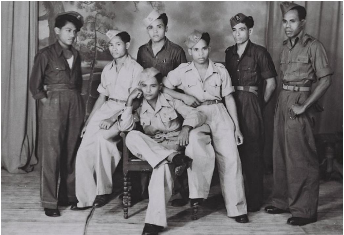
Molukse KNIL-militairen, 1948

Molukkers werden in het gehele Nederlands-Indische gebied ingezet ter handhaving van de orde en het gezag. Gedurende de eerste periode van de twintigste eeuw werd de relatie tussen de Nederlanders en de Molukkers steeds hechter. Een groot gedeelte identificeerde zich met het Nederlands-Indische gouvernement en met het Huis van Oranje.