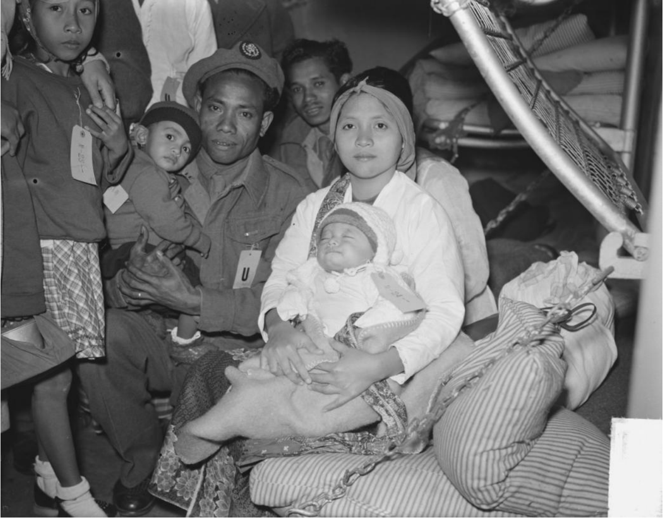
Aankomst Kota Inten met Ambonezen, 21 maart 1951