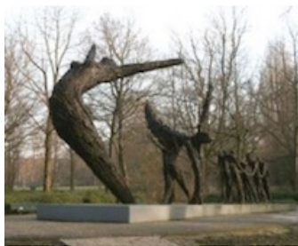
Nationaal monument slavernijverleden in het Oosterpark te Amsterdam ter herdenking van de afschaffing van de slavernij in 1863.

Deze huishoudslavernij zou de eigenaar vooral status hebben opgeleverd en een mildere variant zijn van de loodzware arbeid – inclusief afranselpartijen – op de plantages in Suriname.