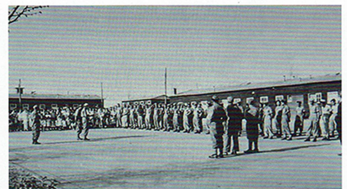
Ochtendappèl met KNIL-militairen in kamp Almère.